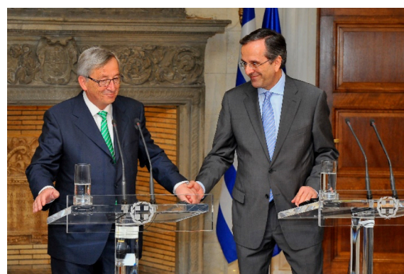
Athens 2013, H.E. Prime Minister Mr. Jean-Claude Juncker and H.E. Prime Minister Mr. Antonis Samaras

Πολλές συναρπαστικές νέες ευκαιρίες για τις Ελληνικές και τις Λουξεμβουργιανές εταιρείες υπάρχουν και στις δύο χώρες, ιδιαίτερα στις ΜΜΕ, σε τομείς όπως το διάστημα, τη ναυτιλία, τα δίκτυα εφοδιασμού, την οικονομία και τις ΤΠΕ.